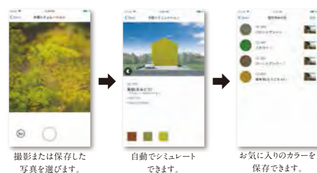
撮影または保存した写真を選びます。自動でシミュレートできます。お気に入りのカラーを保存できます。